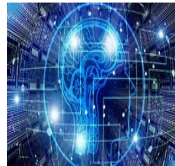
Monialainen turvallisuustutkimus ja koulutusmahdollisuudet